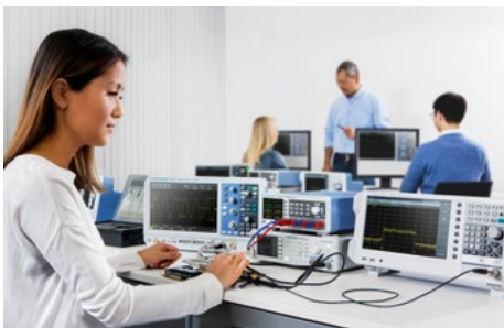
Adaptées pour une utilisation dans l'enseignement, les laboratoires et les baies système

Quoi que fassent des étudiants acquérant une première expérience dans le cadre de travaux pratiques d'électronique, toutes les sorties de la série d'alimentations R&S®NGE100B sont protégées contre les court-circuits et, par conséquent, ne seront pas endommagées.