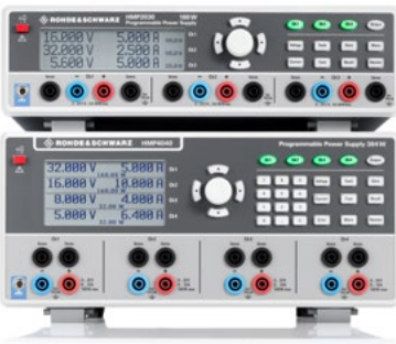
Alimentation à trois canaux R&S®HMP2030 et alimentation à quatre canaux R&S®HMP4040