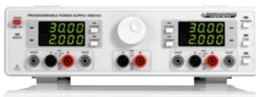
Alimentation arbitraire à trois canaux R&S®HM8143