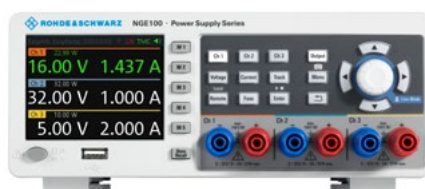
Vue avant du modèle R&S® NGE103B