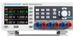
Alimentation R&S®NGE103B à trois canaux