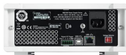
Vue arrière des modèles de la série R&S® NGE100B