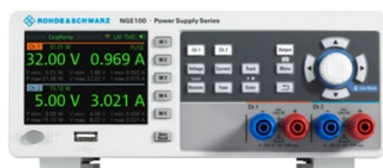
Vue avant du modèle R&S® NGE102B